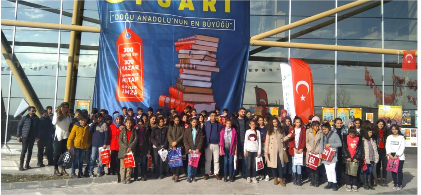
KİTAP FUARI ZİYARETİ