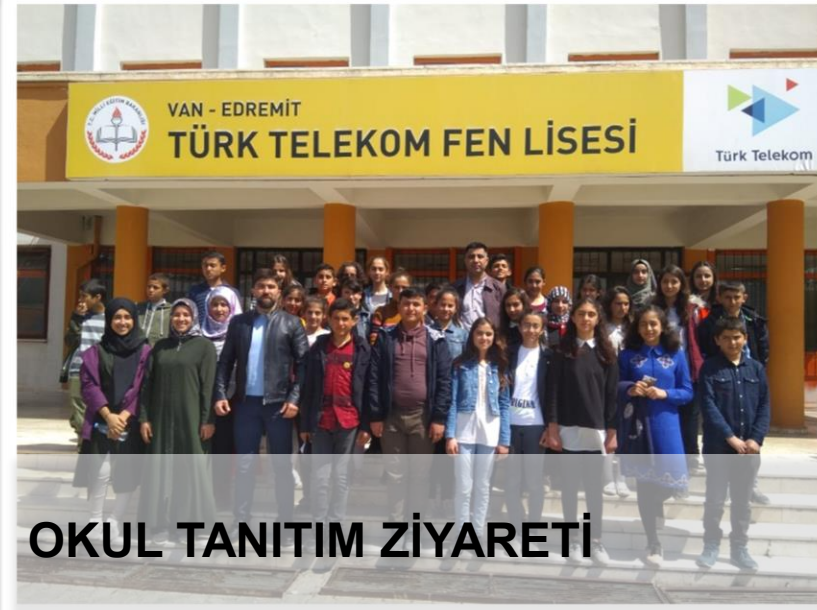
OKUL TANITIM ZİYARETİ