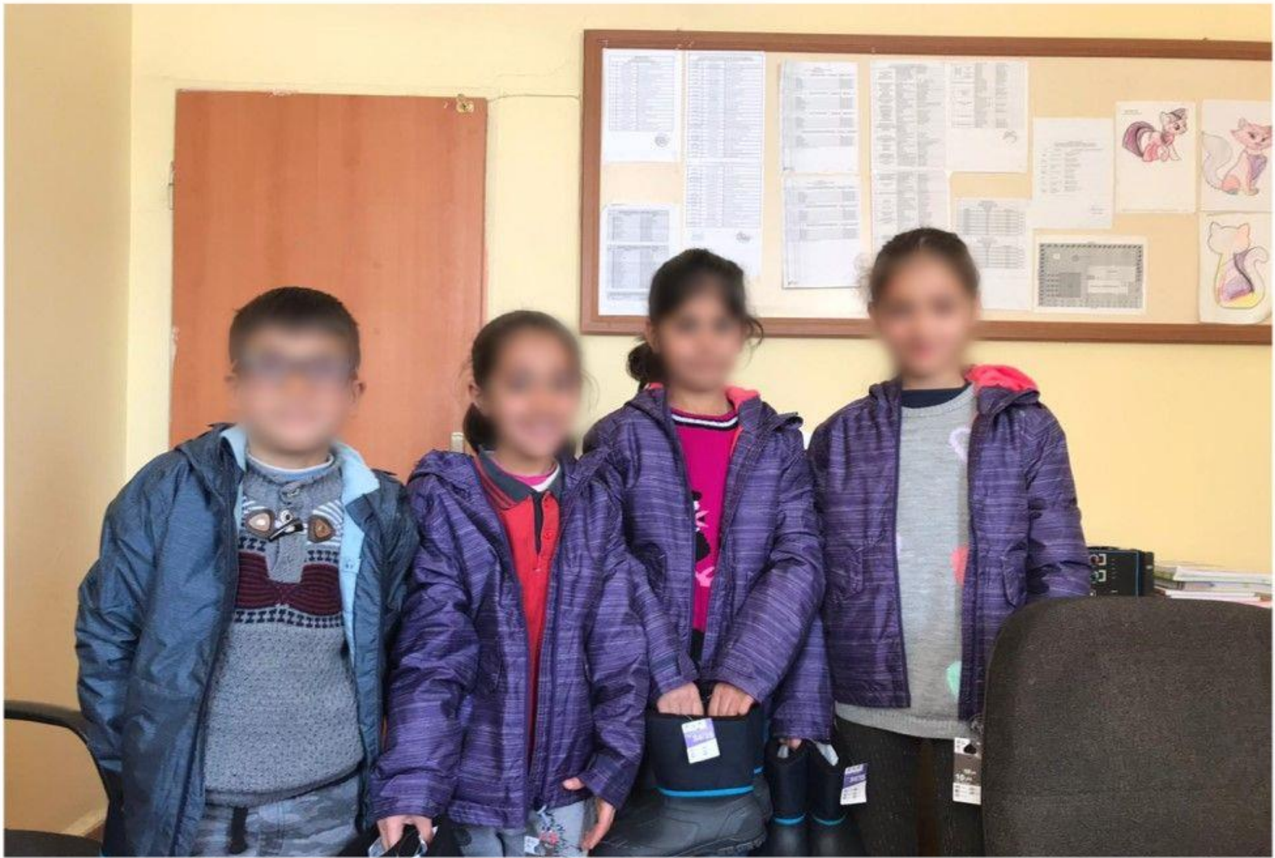
İHTİYAÇ SAHİBİ ÖĞRENCİLERİMİZ İÇİN YARDIM